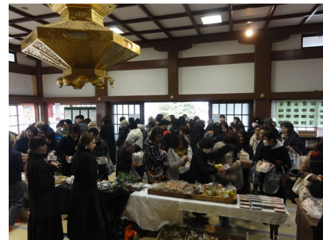
本堂に入りきれないほどの多くの人が!!