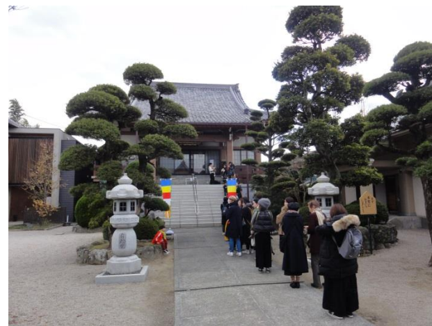
当日朝から並んでありました