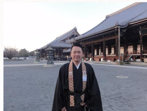
朝早く本願寺の境内にて