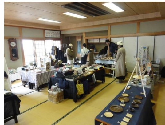
たくさんの商品が並びました

次縁は秋ごろに、オリジナルの真教寺フリーマーケットを予定しています!どうぞお楽しみに!